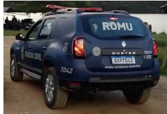
Imagem apenas para referência.