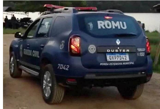
Imagem apenas para referência.